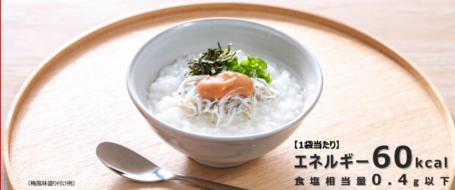
(梅風味盛り付け例)