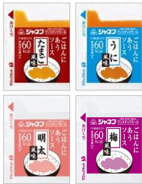
ごはんにあうソース 1袋 (10g)