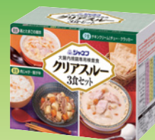
クリアスルー 3食セット