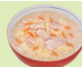
鶏とたまごの雑炊