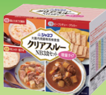
クリアスルー-NB 3食セット 増量タイプ