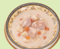
チキンクリームシチュー