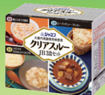
クリアスルー-JB 3食セット