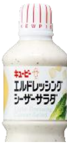
★ レモンチーズだれ