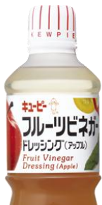
★ フルーツチリビネガーだれ