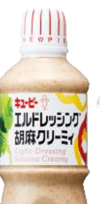
★ ピリ辛胡麻ガーリックだれ