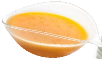
★ クリーミィにんじんだれ