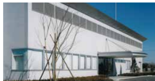
ファインケミカル本部五霞工場